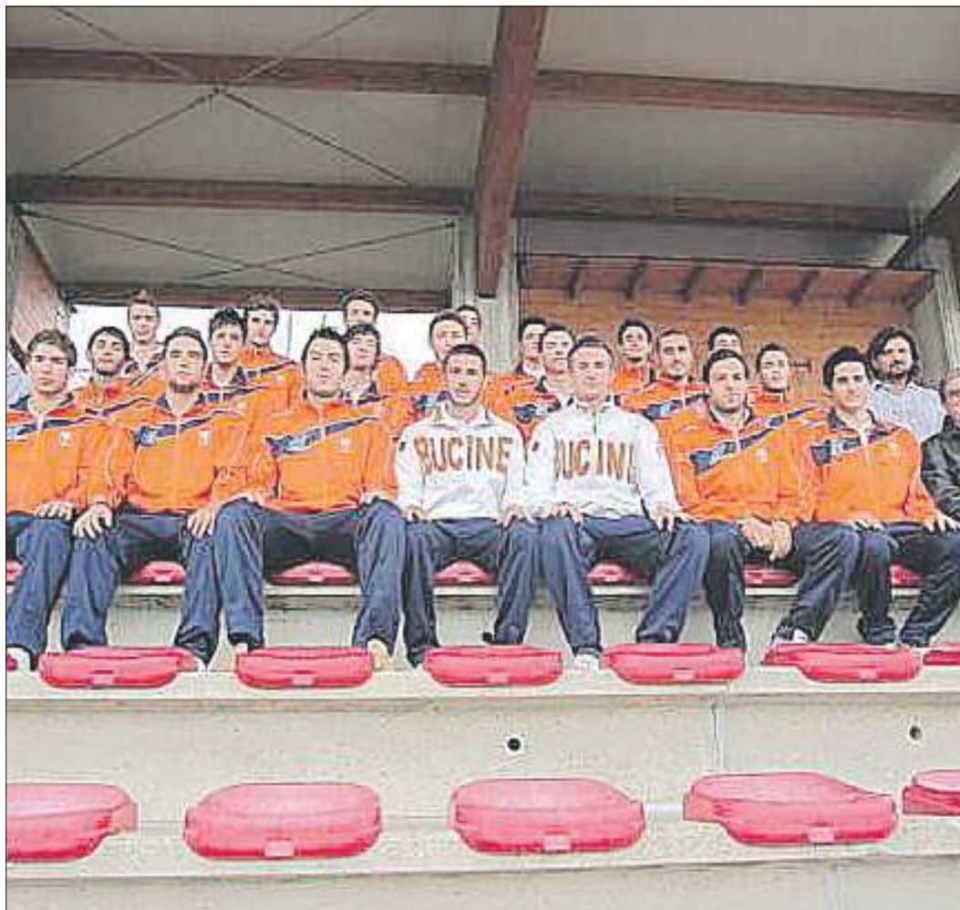
Altri tre punti Altra vittoria per la Bucinese che con il classico punteggio di due a zero, supera anche il Vaggio Piandiscò e vola in classifica