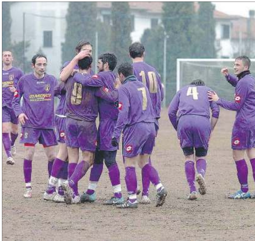
La Castiglione esulta Schianta il Pratovecchio per 3 reti a 0 e ingrassa la classifica. Ora domenica sotto con il Pontassieve capolista che anche ieri ha trionfato sul campo dell'O'Range Chimera