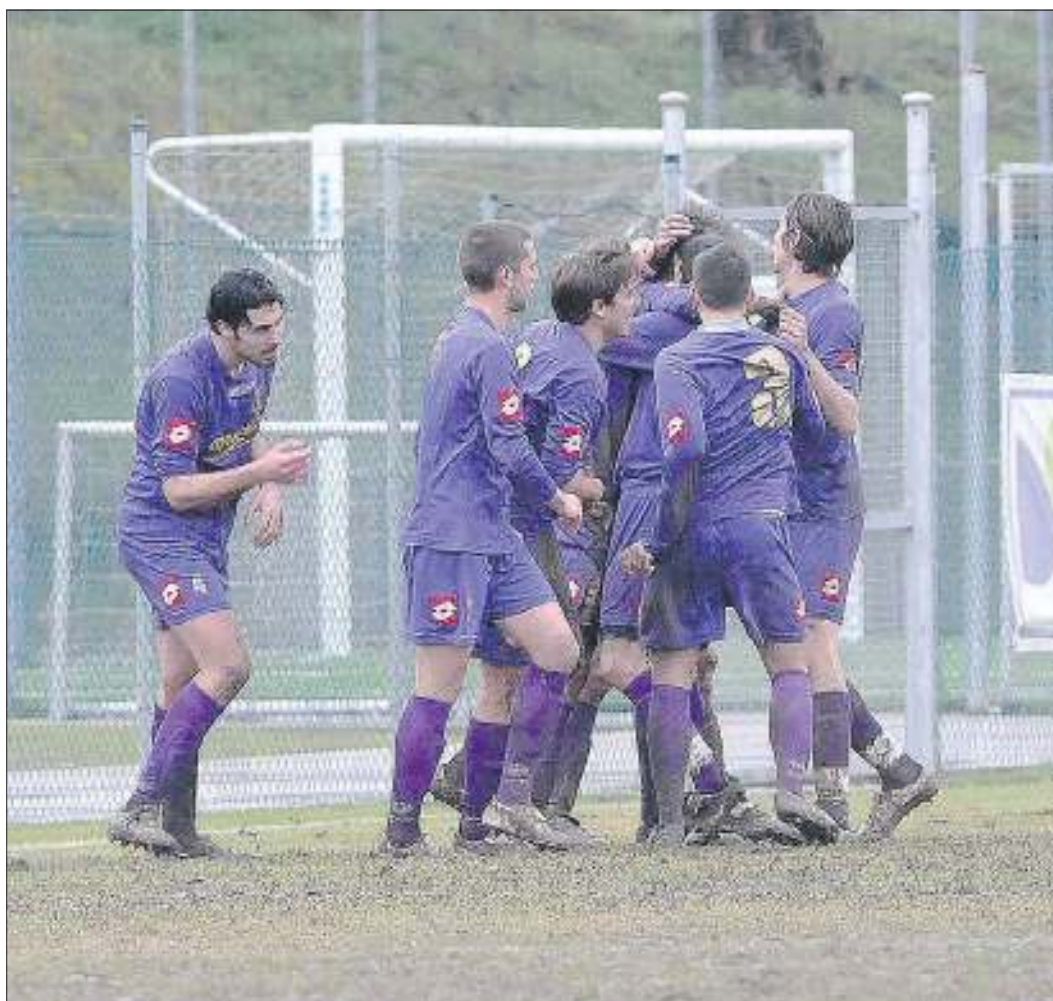
Fa festa la Castiglione. Con il successo sul campo della Poliziana vola al secondo posto in classifica