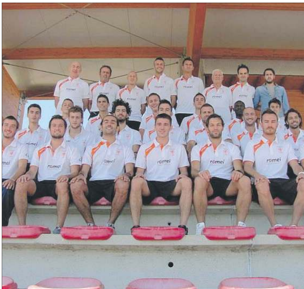
Bucinese La formazione valdarnese che non è andata oltre il pari in casa col Foiano perdendo la testa della classifica tornata al Pontassieve

Alla ripresa del gioco il Foiano cercava di impensierire la retroguardia ospiti.